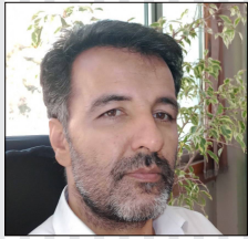
مجید گودرزی - اقتصاددان