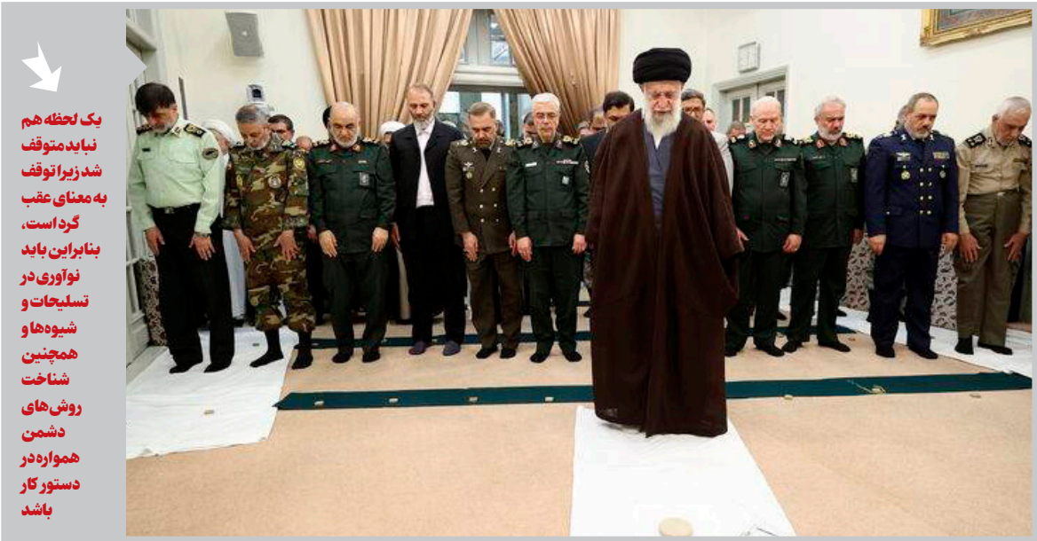
دیدار با فرماندهان عالی نیروهای مسلح مطرح شد؛