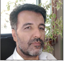
مجید گودرزی - اقتصاددان