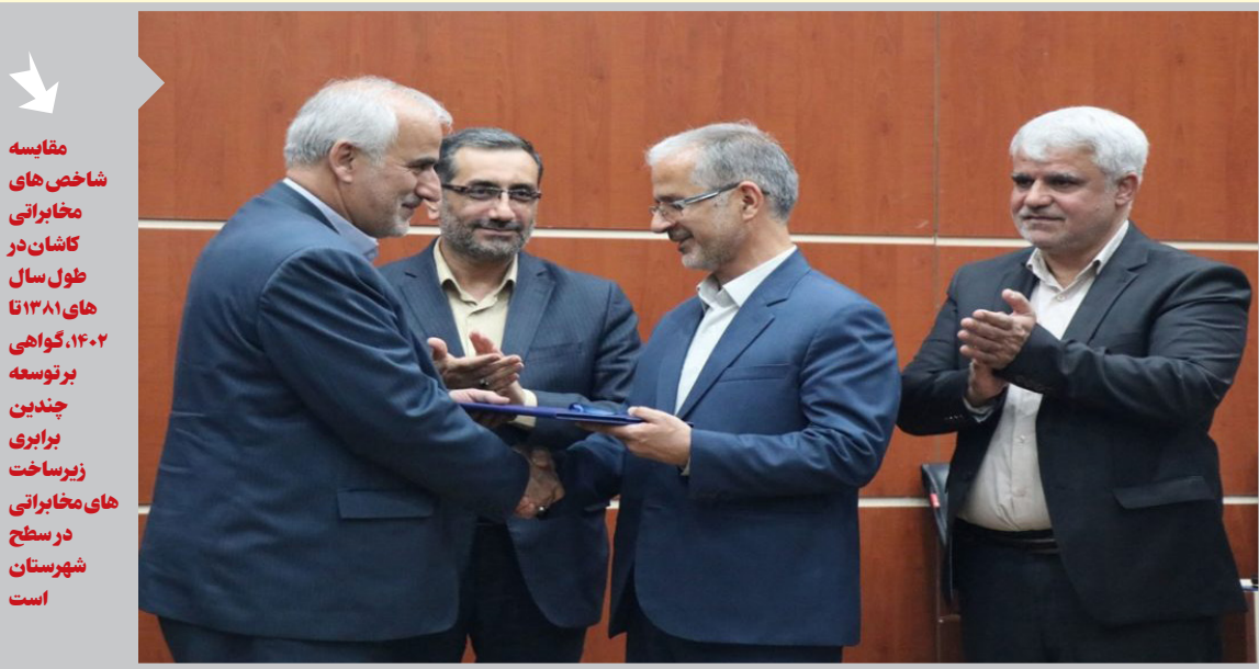
مقایسه شاخص های مخابراتی کاشان در طول سال های ۱۳۸۱ تا ۱۴۰۲، گواهی بر توسعه چندین برابری زیرساخت های مخابراتی در سطح شهرستان است